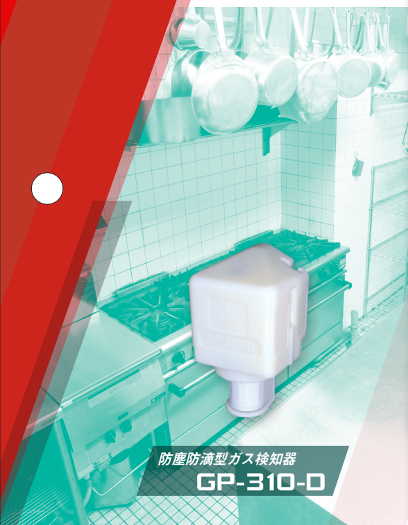
防塵防滴型ガス検知器 GP-310-D

ペーパーライザー、レストラン厨房など、最大3カ所のLPガス漏洩検知を1台で実現します。 5年間メンテナンスフリーで管理も簡単です。