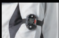
腕装着時(バンド型) ※アームバンド装着