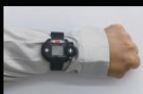
腕装着時(腕時計型) ※時計ベルト装着