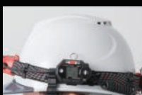
ヘルメットバンド装着時 ※ベルトクリップ装着