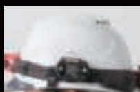
ヘルメットバンド装着時 ※ベルトクリップ装着