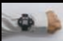
腕装着時(腕時計型) ※時計ベルト装着