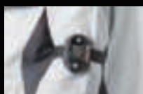
腕装着時(バンド型) ※アームバンド装着