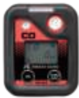
プロテクトカバー: 1個 部品番号: 4123 6450 20