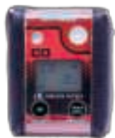
耐熱ケース*1 部品番号: 4732 5029 70