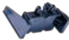
校正キャップ 部品番号: 4123 9694 70