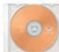
データログ管理プログラム 部品番号: 9811 0930 30