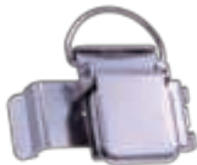
アリゲータークリップ 部品番号: 4711 7111 10