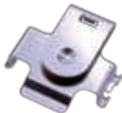
ヘルメット用クリップ*2 部品番号: 4732 4978 10