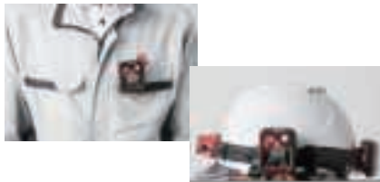
ヘルメット上のバンドに装着したイメージ