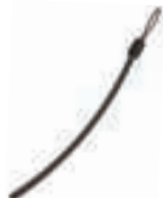
ハンドストラップ 部品番号: 0888 0605 90