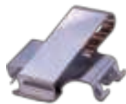
ベルトクリップ: 1個 部品番号: 4123 6463 30