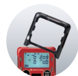
防護蓋 (料號 4777 4161 10)