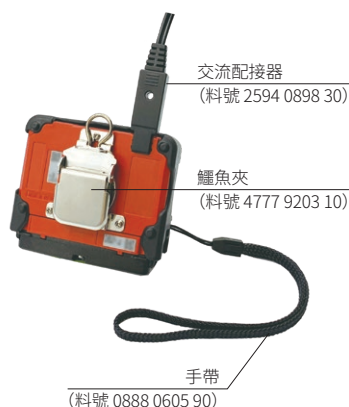
交流配接器 (料號 2594 0898 30)