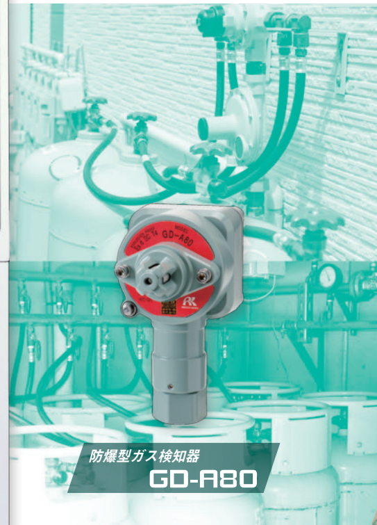
防爆型ガス検知器 GD-A80