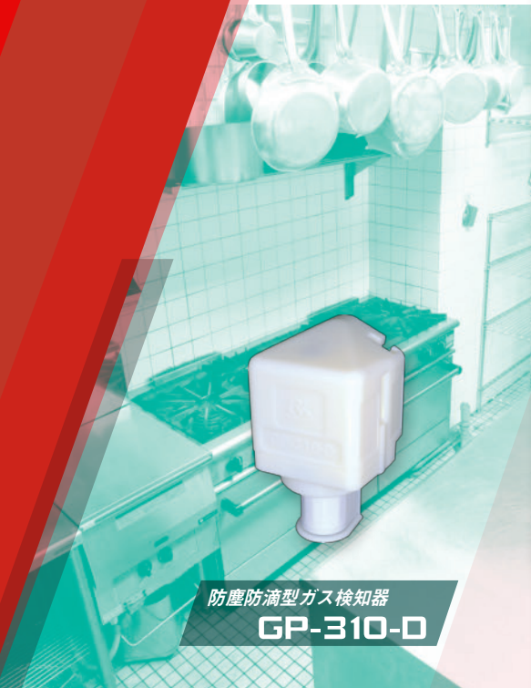
防塵防滴型ガス検知器 GP-310-D

ペーパーライザー、レストラン厨房など、最大3カ所のLPガス漏洩検知を1台で実現します。 5年間メンテナンスフリーで管理も簡単です。